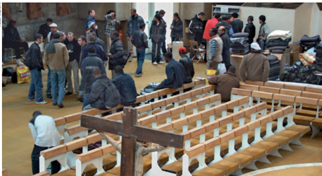
Ehrenamtliche geben einer Gruppe Asylsuchender vorübergehend Quartier in der Jesuitenkirche in Wien-Lainz ...