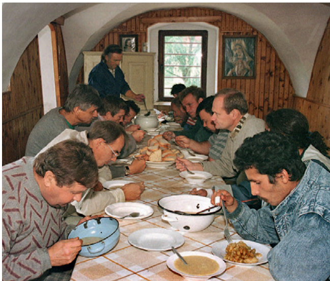
Warme Mahlzeit aus der Suppenküche

Arbeit, und dazu möchte ich ein Beispiel aus unserem Umfeld erzählen: Seit fünf Jahren lebt unsere kleine Gemeinschaft in Halle in der Silberhöhe. Das ist ein Stadtteil, der erst vor 30 Jahren entstand und seit der Wende im Zusammenhang mit der großen Arbeitslosigkeit und dem Geburtenrückgang langsam immer mehr schrumpft. In der unmittelbaren Nachbarschaft beträgt die Arbeitslosigkeit sicher über 40%. Die Menschen leiden sehr darunter, denn es ist eine demütigende Erfahrung, plötzlich nicht mehr gebraucht zu werden. Nun haben sich einige von ihnen von einer Initiative ansprechen lassen, die zweimal pro Woche in einem Begegnungszentrum des Viertels eine warme Mahlzeit kocht und Hartz IV Empfängern für einen Euro anbietet. Es ist eine rein