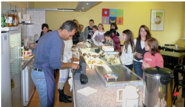
Ehrenamtliche in der Schul-Cafeteria im Canisius-Kolleg in Berlin

weise Institutionen Pflichten gegenüber den ihnen anvertrauten Menschen haben, dürfen sie diese nicht einfach delegieren, und schon gar nicht zu Sparzwecken.