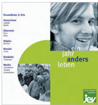
Der neue Folder von JEV

Das Telefon klingelt, ein JEV beklagt, dass die Waschmaschine kaputt ist, der Wasserkocher nicht funktioniert oder das schnurlose Telefon den Geist aufgegeben hat. „Ich brauche dringend für die Universität eine Bestätigung, dass ich gerade ein FSJ mache. Könnt Ihr die bitte an meine Eltern schicken?“ Diese Liste ließe sich beliebig fortsetzen und unser Team, das insgesamt aus vier hauptamtlichen Personen und einem nebenamtlichen Ex-JEV besteht, ist gut beschäftigt, auf alle Anfragen einzugehen. Dazu läuft das komplette Rahmenprogramm, was sich für einen Jahrgang, neben den Kennlernwochenenden, aus der Inkulturations- und Einführungswoche, der Herbst- und Frühjahrsreflexion, den Exerzitien und der Abschlusswoche zusammensetzt. Das Programm wird durch ein Rückkehrseminar nach dem Einsatz abgerundet. Dazu kommen die Besuche in den Kommunitäten und Arbeitsstellen bis zu zwei Mal während des Einsatzes durch die verschiedenen Teammitglieder. Dieser persönliche Kontakt zu den JEVs ist im Vergleich mit anderen FSJ-Trägern eine Stärke von JEV.