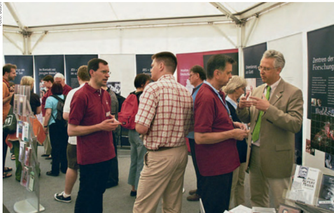
Interessierte Besucher/innen am Stand der Jesuiten beim Katholikentag in Osnabrück