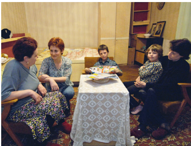
Ehrenamtliche zu Besuch in einem Frauenhaus

big an ihre Freunde und Förderer schreiben, um diese an ihrem Einsatz teilhaben zu lassen.