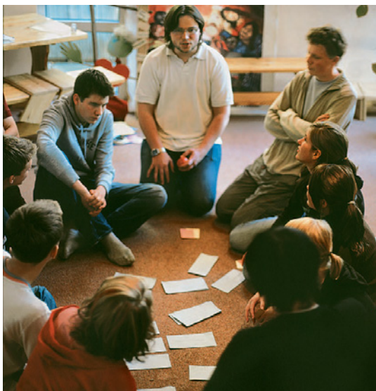
Ausbildung junger Menschen zu ehrenamtlichen Jugendleitern in der KSJ Hamburg

amtliche gewinnen können, die ihre Zeit und ihr Engagement in den Dienst der Gruppenleiterausbildung stellten. Sie hatten damit eine große Verantwortung, denn ihre Arbeit entschied darüber, wie Gruppenleiter in Zukunft mit ihren Gruppen umgehen sollten. Die ständige Aus- und Fortbildung der Ehrenamtlichen im AK war immer ein fundamentaler Bestandteil der ehrenamtlichen Tätigkeit. Diese Qualifizierung der Multiplikatoren ist immens wichtig und muss auch eine hohe Qualität haben. Dies ist nur durch hauptamtliches Personal zu gewährleisten.