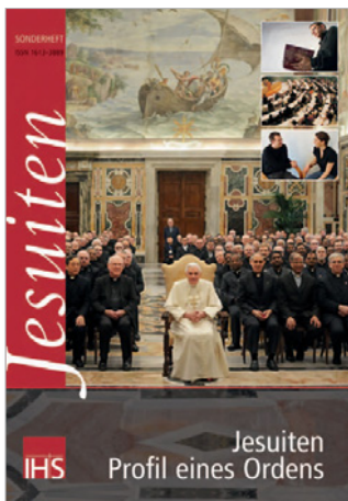
Sonderheft „JESUITEN – Profil eines Ordens“

Wenige Wochen nach dem Ende der 35. Generalkongregation und pünktlich zum Katholikentag in Osnabrück wurde das Sonderheft „JESUITEN – Profil eines Ordens“ fertig.