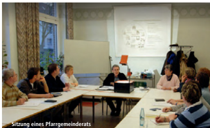
Sitzung eines Pfarrgemeinderats