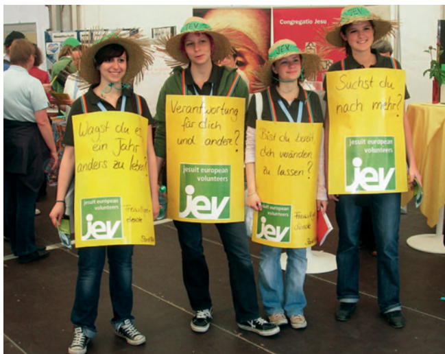
Teilnehmerinnen aus dem aktuellen JEV-Programm werben beim Katholikentag in Osnabrück für den Freiwilligendienst der Jesuiten

Parallel dazu laufen bereits ab Oktober die Bewerbungen für den kommenden Jahrgang, und während eben ein Jahrgang im Einsatz ist, gehen die Vorbereitungen mit den Kennlernwochenenden etc. in die nächste Runde. Dazu kommt jede Menge Administration und Buchhaltung, denn so ein Betrieb will organisiert sein. Im Moment wird uns das Leben durch zahlreiche Gesetzesänderungen schwer gemacht. Der bürokratische Aufwand für die notwendige finanzielle Unterstützung von JEV wächst ständig. Das alles geht aber auch nur mit der Hilfe vieler Ex-JEVs, die sich bereitwillig bei den Tagungen und auch zwischendurch zur Verfügung stellen.